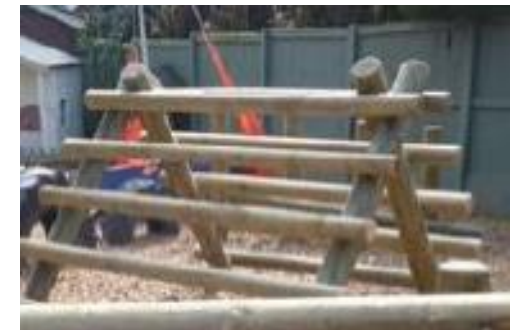
Jeux en bois