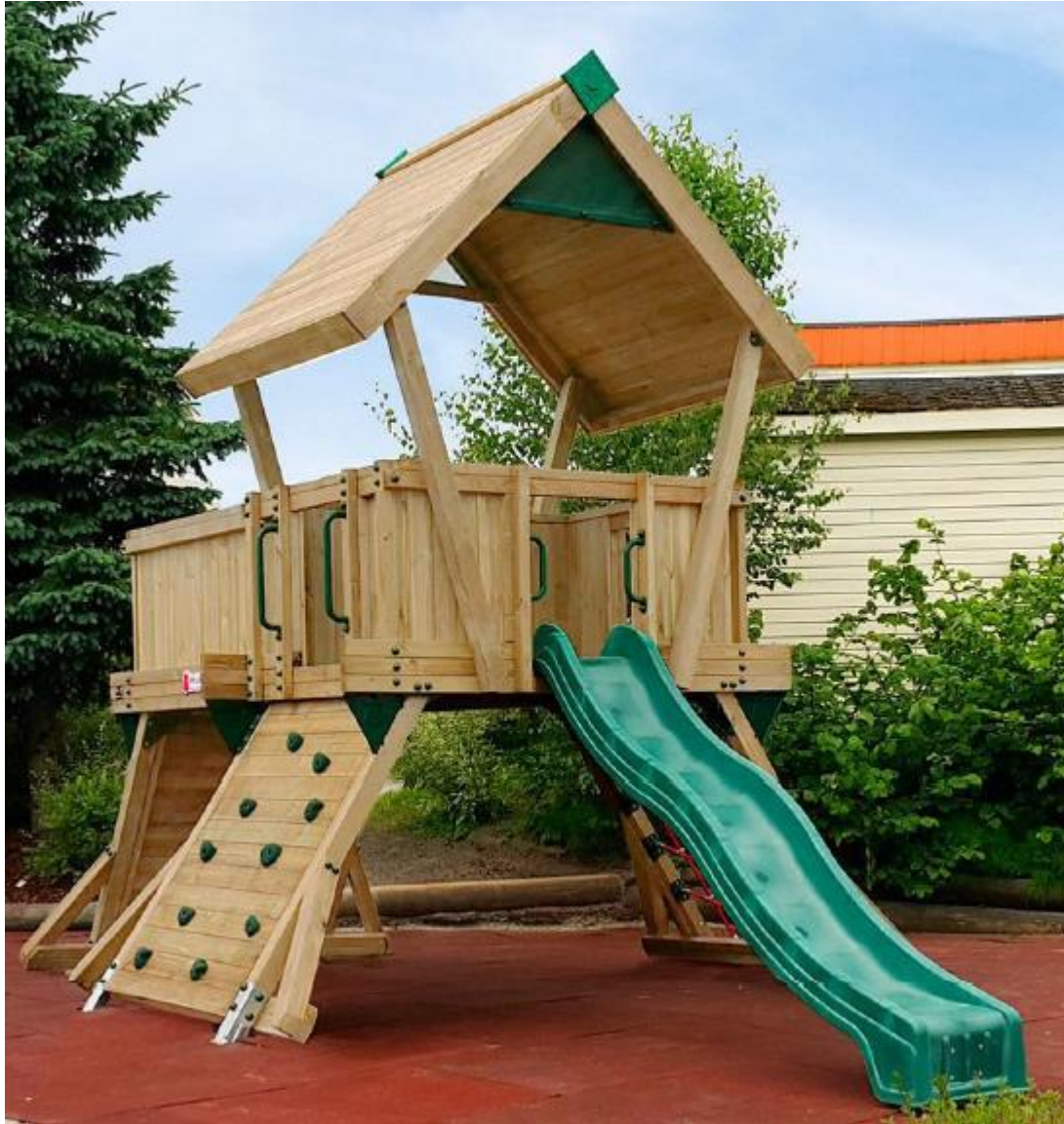
Climbing Frame Q3 de Hy Land (option Douglas)